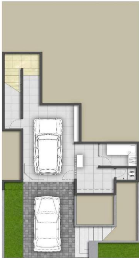
TYPE 9 GROUND FLOOR 0 1 2 4 6m