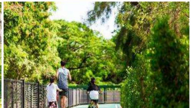
Jogging & Cycling Track