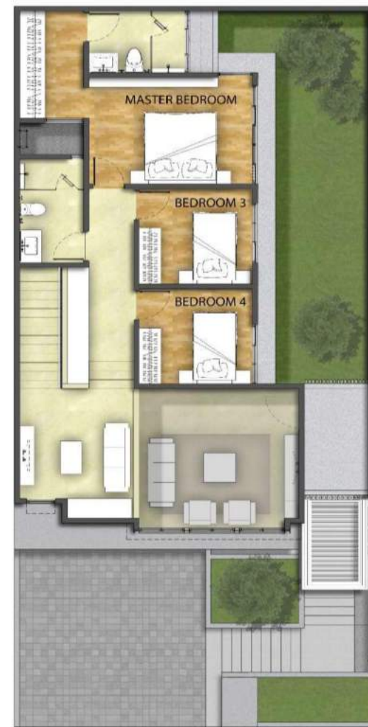
TYPE 10 UPPER FLOOR