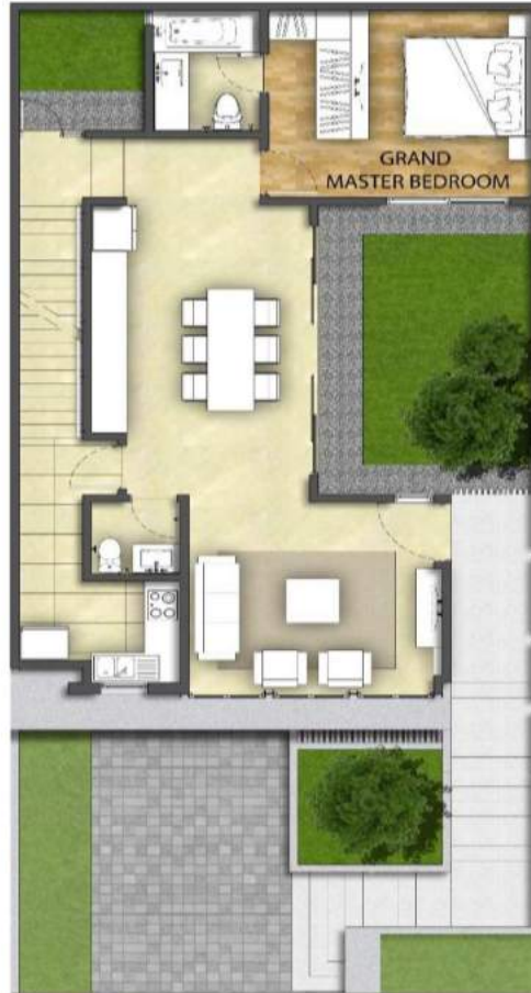
TYPE 9 FIRST FLOOR 0 1 2 4 6m