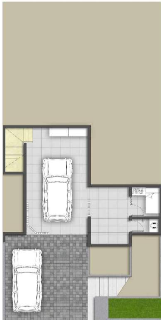
TYPE 10 GROUND FLOOR