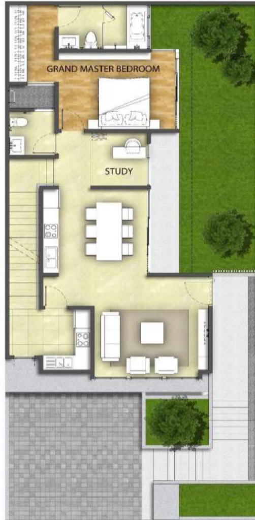
TYPE 10 FIRST FLOOR