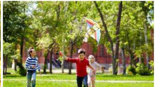
Flying Kite Playground