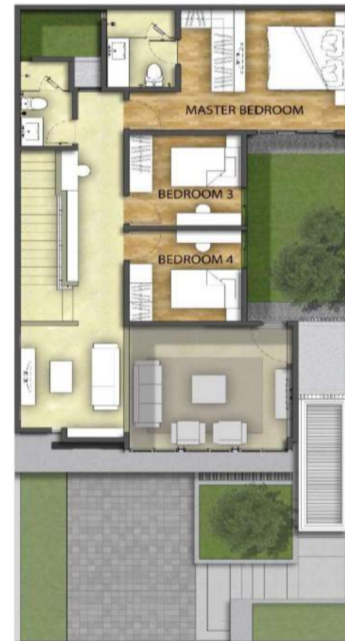
TYPE 9 UPPER FLOOR 0 1 2 4 6m