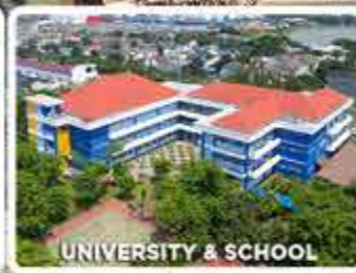
UNIVERSITY & SCHOOL