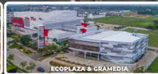
ECOPLAZA & GRAMEDIA