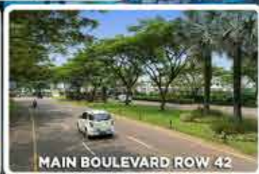
MAIN BOULEVARD ROW 42