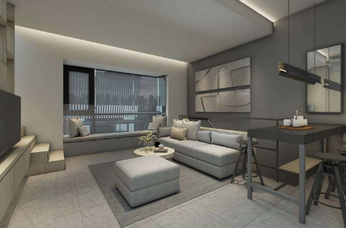
Studio Living Room