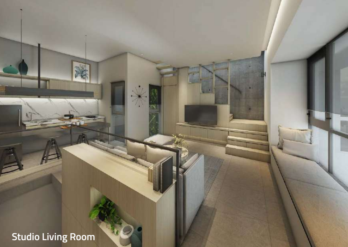
Studio Living Room