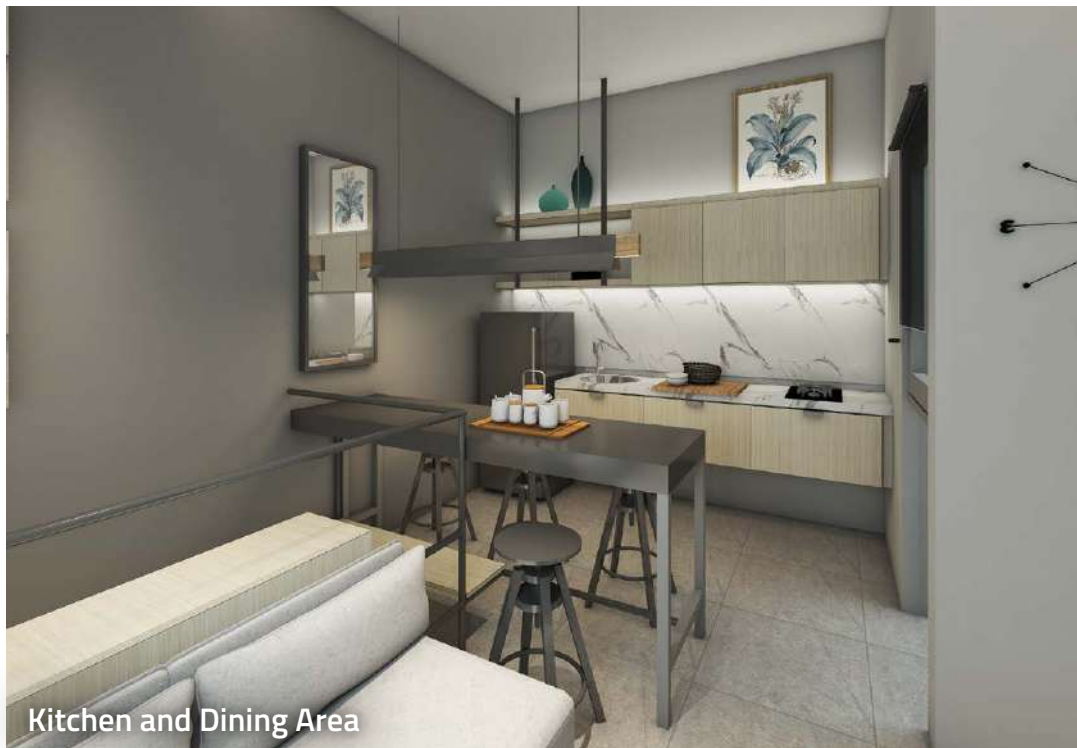
Kitchen and Dining Area