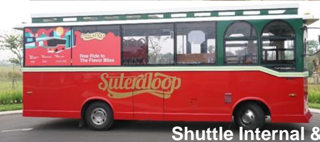
Shuttle Internal & Jakarta