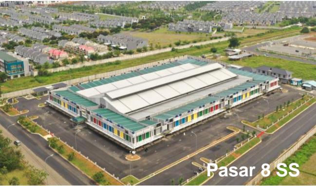
Pasar 8 SS