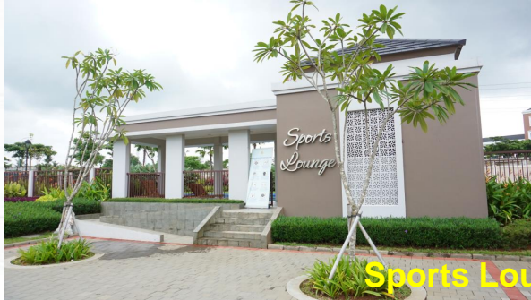
Sports Lounge Bayu