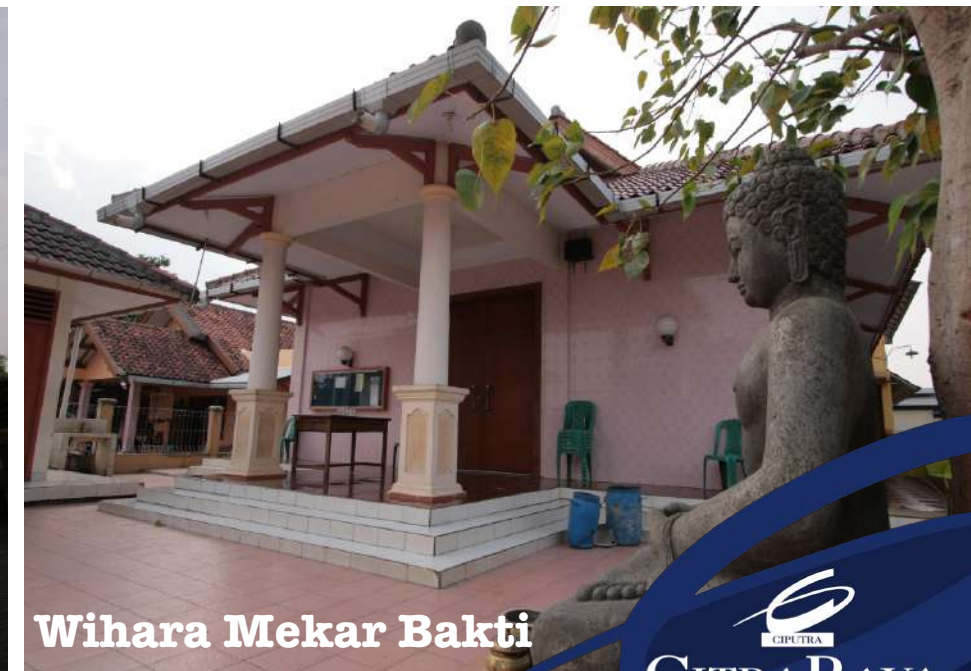
Wihara Mekar Bakti