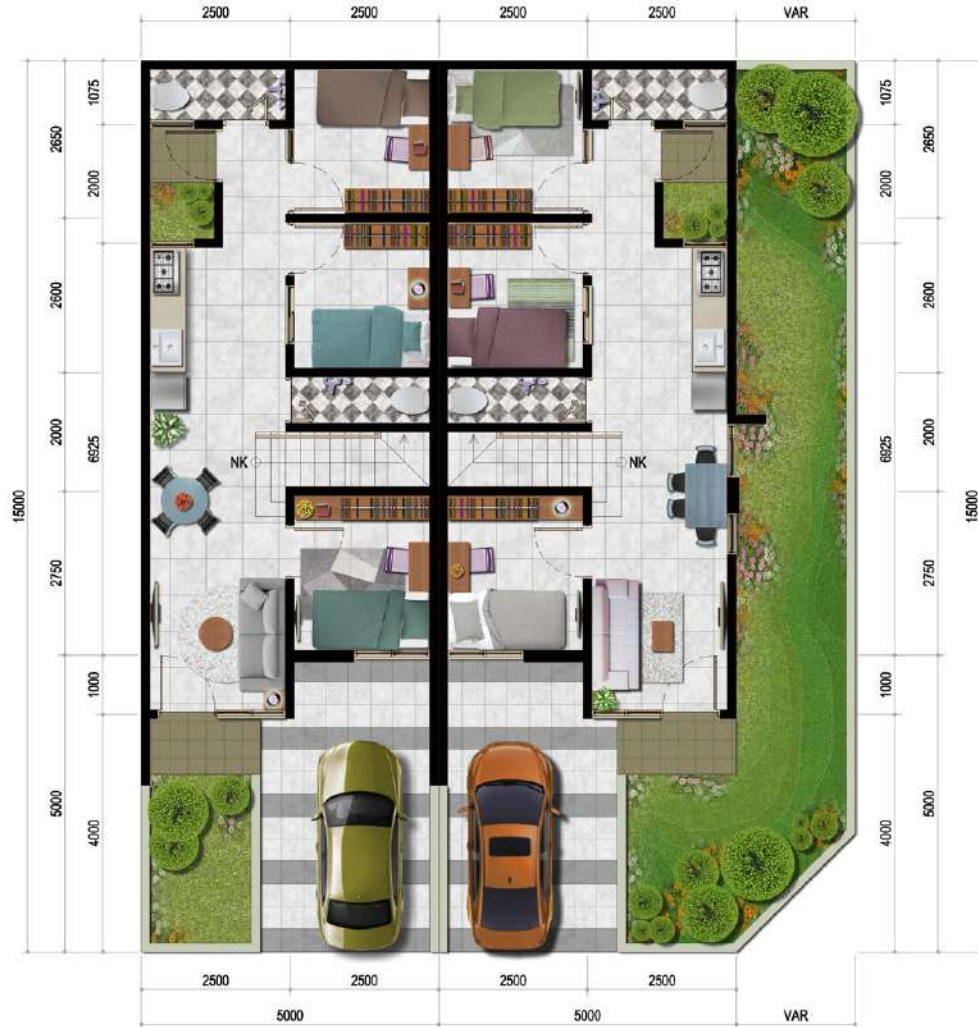
DENAH LANTAI DASAR