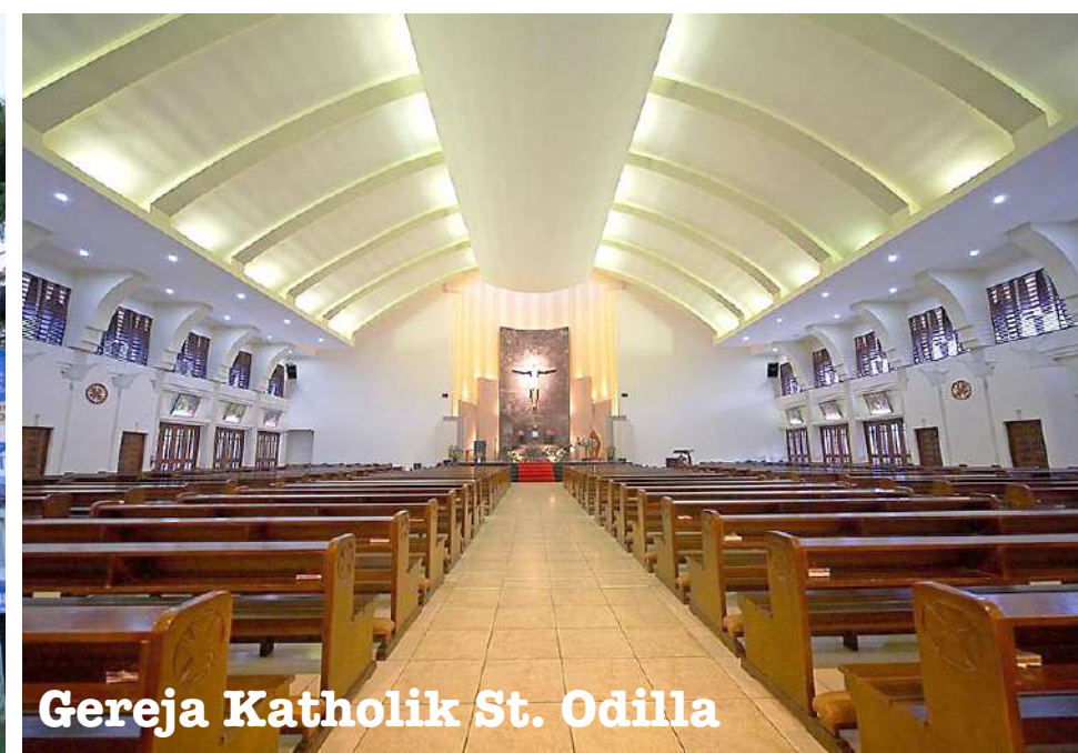
Gereja Katholik St. Odilla