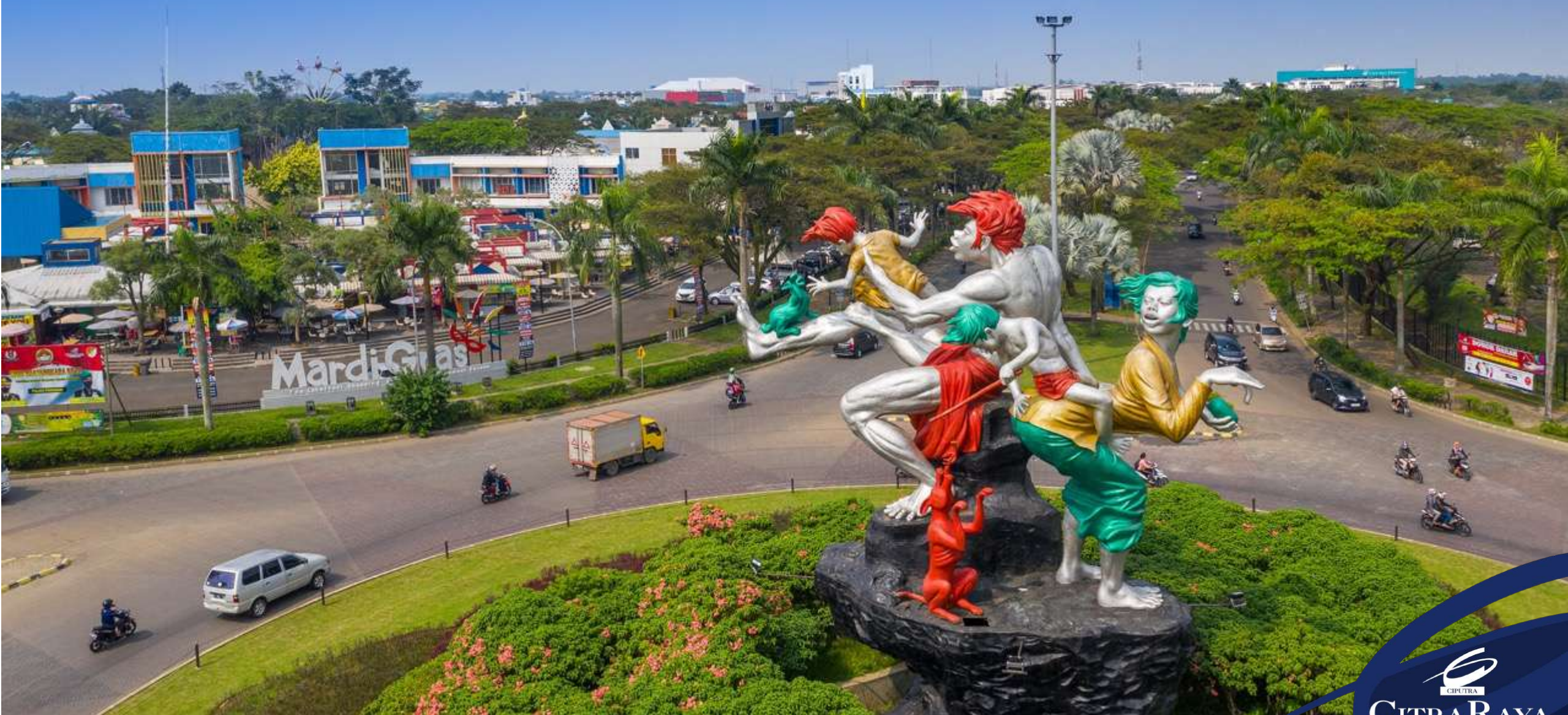
Foto Aktual Kawasan Kota CitraRaya Tangerang