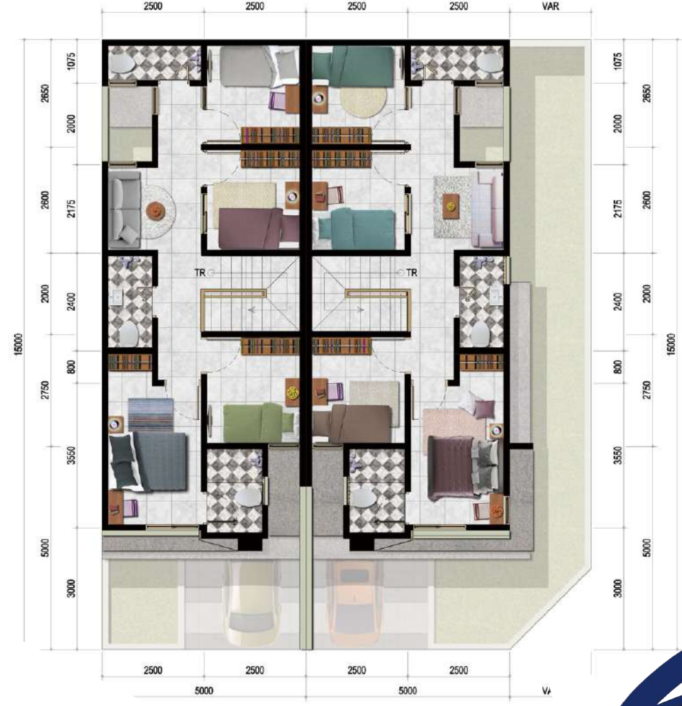
DENAH LANTAI ATAS