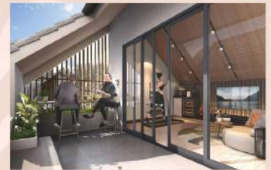
Attic B (outdoor)