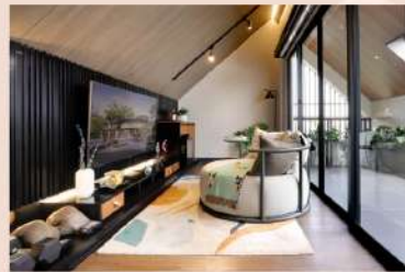
Attic B (indoor)